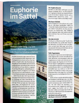
Muster Digi-Ad Integration