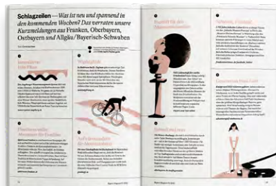
Bayern-News: Meldungen aus den bayerischen Regionen