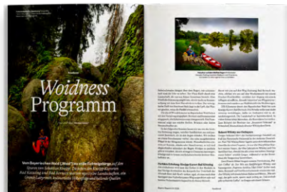
Roadbook: Touren auf Bayerns schönsten Routen und Flüssen