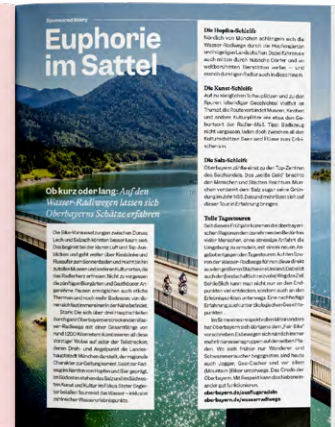
Muster Digi-Ad Integration