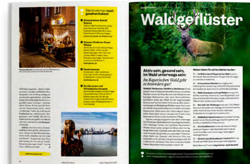
Muster 1/1- Seite