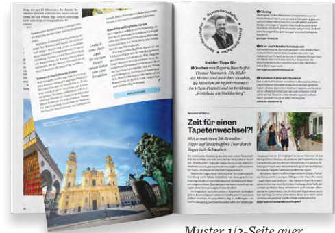
Muster 1/2-Seite quer