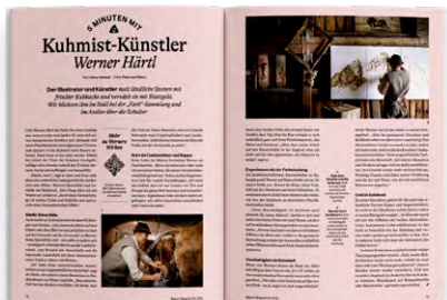
5 Minuten mit ... : Interviews mit echten Bayern-Insidern