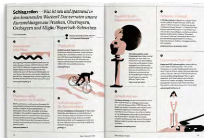
Bayern-News: Meldungen aus den bayerischen Regionen