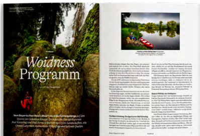
Roadbook: Touren auf Bayerns schönsten Routen und Flüssen