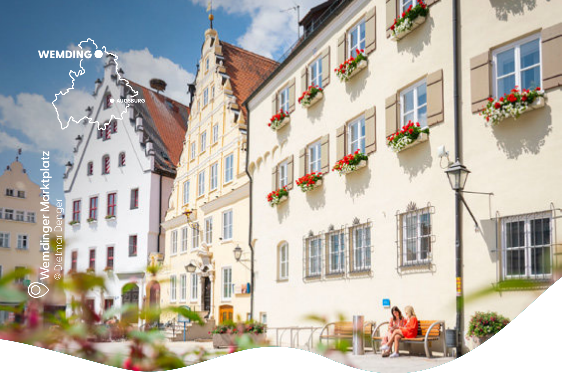
WEMDING ● AUGSBURG Wemdinger Marktplatz