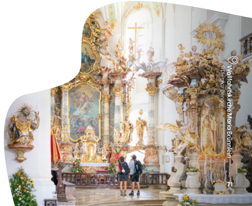
Wallfahrtskirche Maria Brunnlein

kreisrunden Stadt führt der Weg über den Marktplatz, vorbei an bunten Giebeln und dem Geburtshaus von Leonhart Fuchs, dem berühmten Botaniker und Namensgeber der Fuchsie. Im Frühjahr füllt sich die Stadt mit Duft und Farbe, wenn der Fuchsien- und Kräutermarkt Händler und Besucher anzieht. Und im Sommer blüht Wemding zu Ehren seines berühmten Sohnes auf – dann steht auf dem Marktplatz die Fuchsienpyramide mit über 700 blühenden Pflanzen.