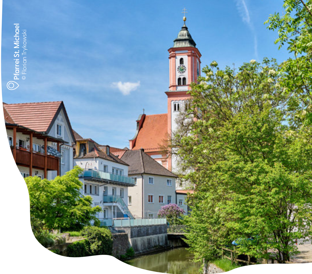
📍 Pfarrei St. Michael

Am Stadtrand beginnt eine andere Welt: das Krumbad. Seit über sechshundert Jahren sprudelt hier Wasser über den sogenannten Badstein, einen Kalkstein, der Mineralien freisetzt und heilende Wirkung entfaltet. Schon im Mittelalter kamen Menschen hierher, um Linderung zu suchen. Heute knüpft das älteste Heilbad Schwabens an seine Tradition an und ergänzt sie um moderne Gesundheitsangebote. Die Rokokokapelle, die umgebenden Wälder und die Stille des Ortes machen das Krumbad zu einem Platz, an dem Ruhe Teil der Therapie ist.