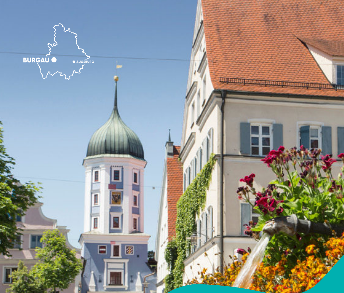
Blockhausturm (Stadtter)