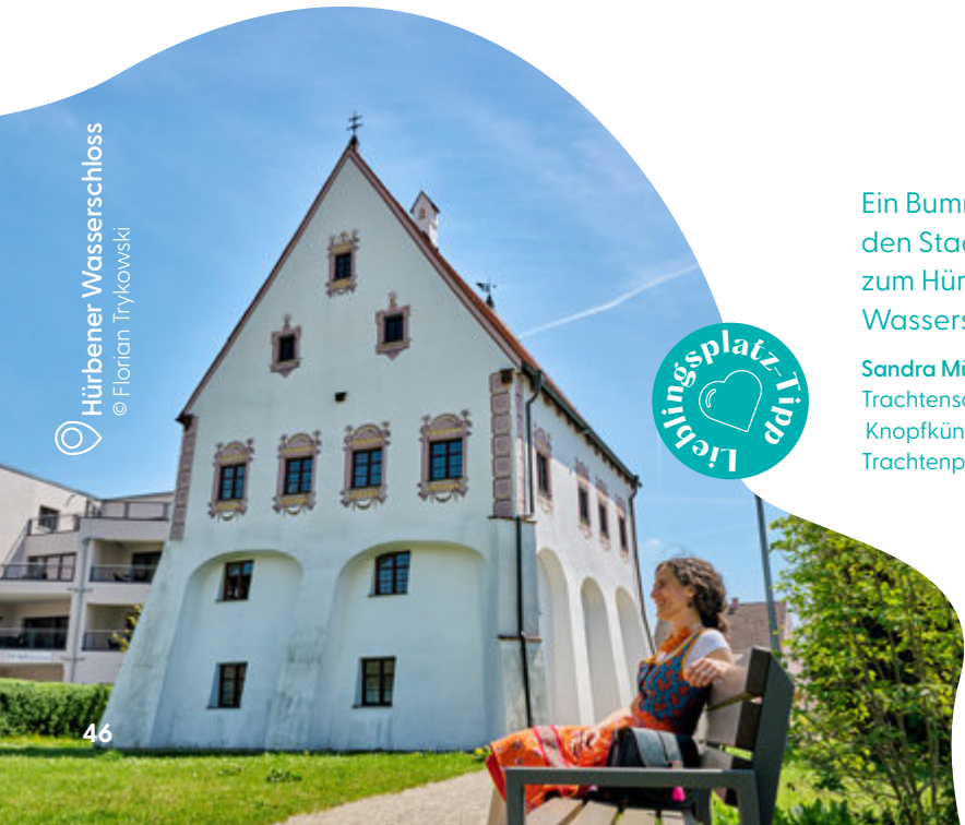
📍 Hübener Wasserschloss