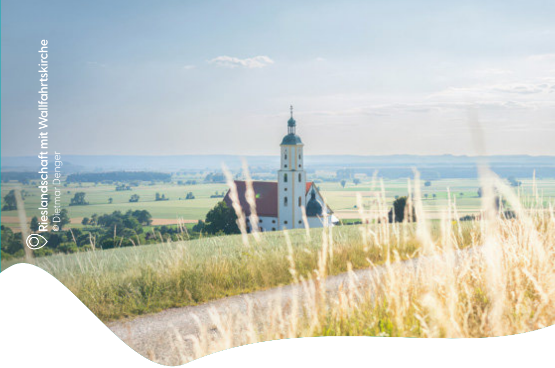
Rieslandschaft mit Wallfahrtskirche