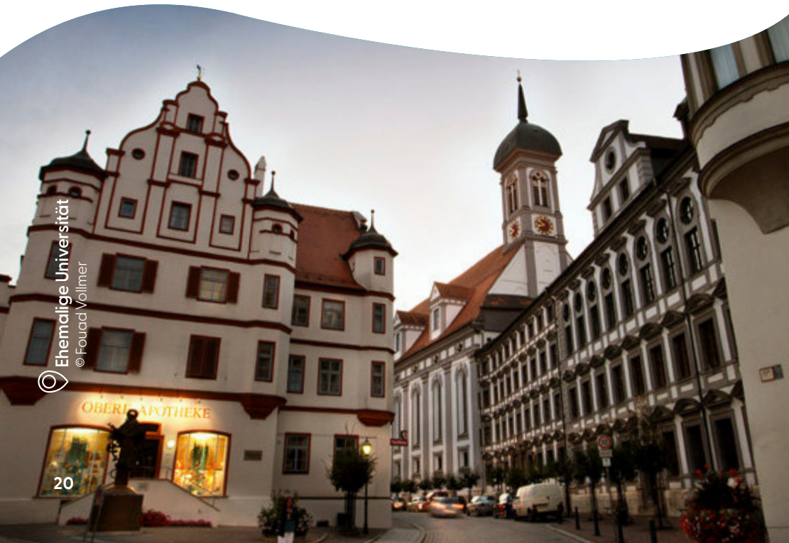
Ehemalige Universität

und der Stadt um 1740 zeigen. Ein weiteres Wahrzeichen ist die Basilika St. Peter, deren Turmaufsatz von einem Vorfahren Mozarts stammt. Entlang der Königstraße mit ihrem Stadtturm zeigt sich Dillingens historisches Zentrum, das bis heute den Geist von Bildung, Glauben und Bürgerstolz bewahrt. In dieser Stadt studierte auch Sebastian Kneipp, der die Heilkraft des Wassers an sich selbst erprobte und damit den Grundstein für seine berühmte Therapie legte.