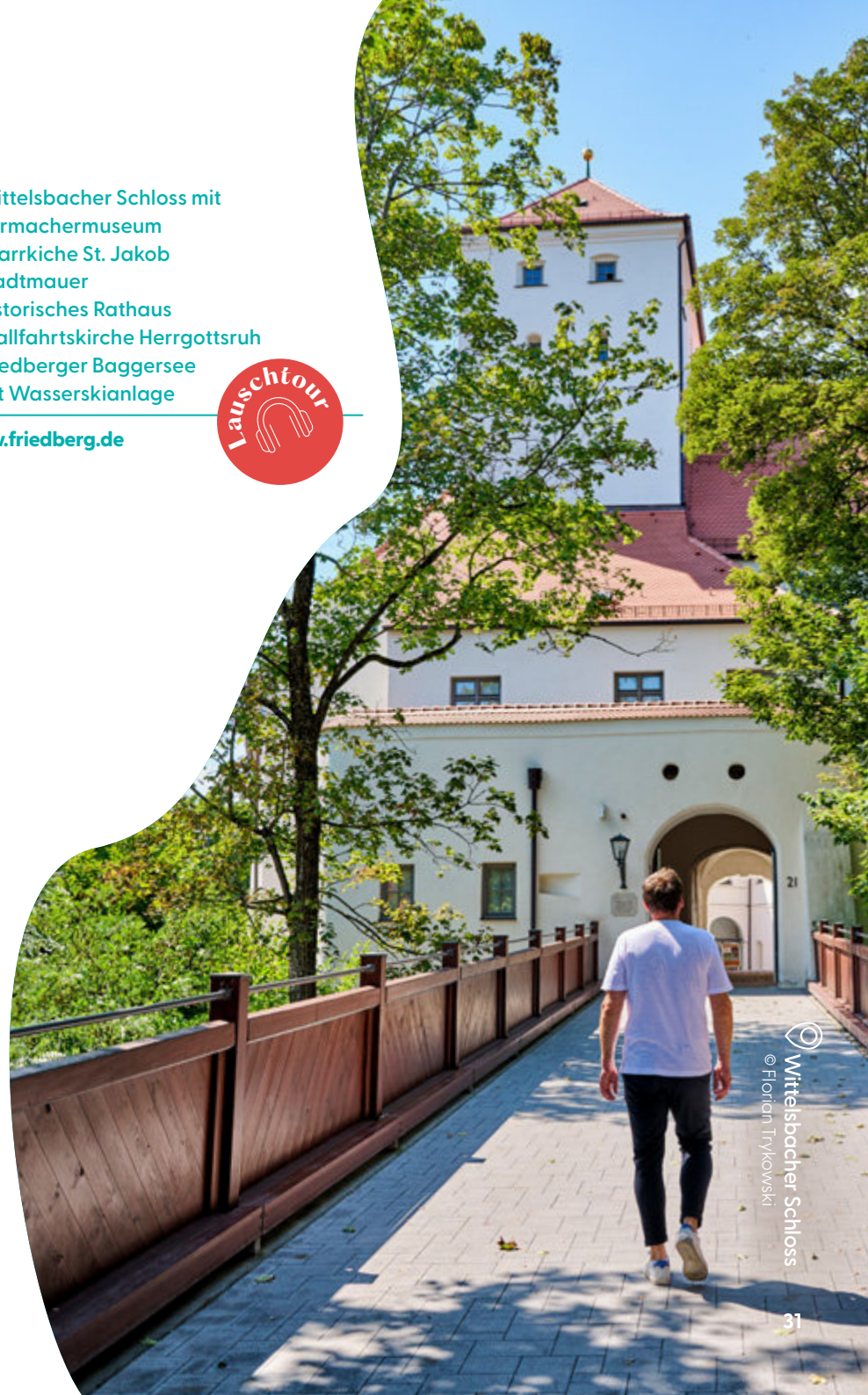
Wittelsbacher Schloss