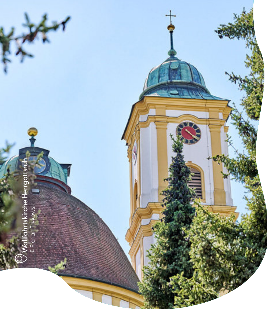
Wallfahrtskirche Herrgottsruh